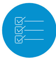
SonoSim 知識アセスメント 習熟度測定用のQ&Aを搭載