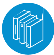
SonoSimコース オンライン座学指導

SonoSim Ultrasound Training Solution では、次の3つのステップで学習します。 安全かつ繰り返しトレーニング可能な学習環境で、基本的な超音波の知識とスキルを習得できます。