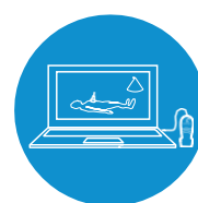
SonoSim シミュレータ ハンズオンスキャン