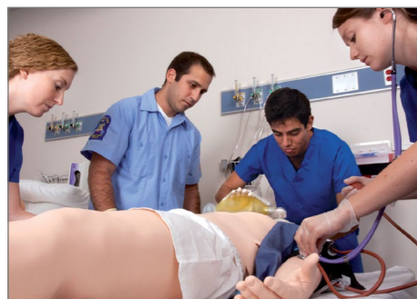
チームトレーニング