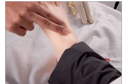
脈拍触診の検知および記録