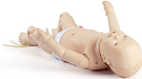
ナーシング ベビー