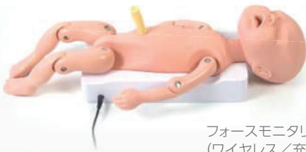
フォースモニタリング用胎児 (ワイヤレス/充電式)