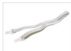
ヘッドストラップ

酸素インレット付きポケットマスク 製造販売承認番号:21900BZX00032000 JMDNコード:36066000 レールダル ポケットマスク 製造販売届出番号:13B1X00175000007 JMDNコード:70564000 レールダル 小児用ポケットマスク 製造販売届出番号:13B1X00175000008 JMDNコード:70564000