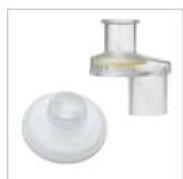
アップデートバック