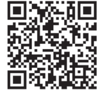
TruVent 紹介動画 (7分)

TruVent を使って、学習者は人工呼吸器の操作に必要な基本的なスキルを簡単に習得できます。インストラクターは、従来のクラス単位の対面式授業や、別の場所からのリモートで1人または複数の学習者を同時にトレーニングすることができます。