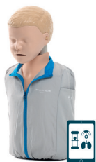
Little Junior Q CPR