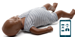
Little Baby Q CPR