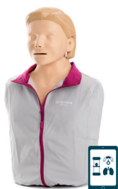
Little Anne Q CPR