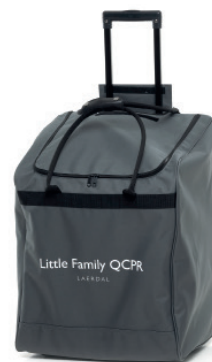
Sac de transport

Le pack Little Family est un ensemble pratique de mannequins de formation de secourisme adaptés à chaque âge doté d'une mallette de transport à roulettes pour en faciliter le transport et le stockage.