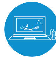
SonoSim シミュレータ ハンズオンスキャン