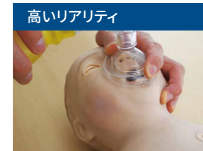
高いリアリティ 気道の形状や皮膚の質感など、実際の感覚を忠実に再現しています。