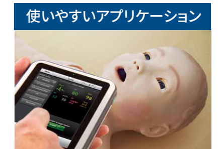
使いやすいアプリケーション PC だけでなく、SimPad PLUS でも使用でき、インストラクターが自在にシミュレーションを操作することができます。