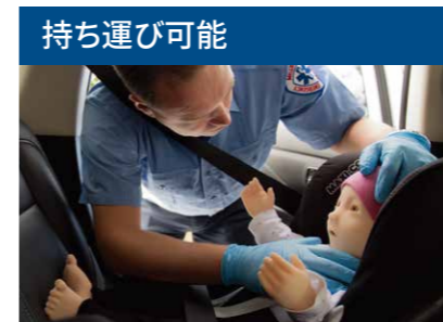
持ち運び可能 完全ワイヤレス設計を採用し、現場でのよりリアルなシミュレーショントレーニングが可能です。