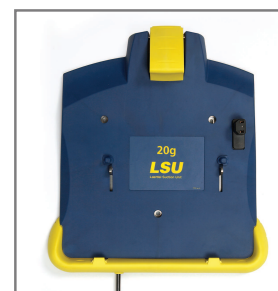
Support mural LSU

Produit conforme aux exigences essentielles de la directive 93/42EEC ; Directive des dispositifs médicaux telle qu'amendée par 2007/47/EC.