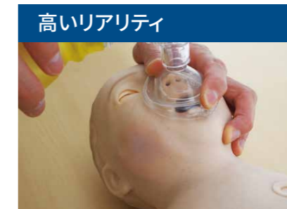
高いリアリティ 気道の形状や皮膚の質感など、実際の感覚を忠実に再現しています。