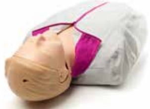
リアルで耐久性に優れた軽量デザイン

リアルで耐久性に優れたCPRトレーニングマネキンであるリトルアン ® QCPR マネキンは、QCPR測定機能とフィードバックテクノロジーを搭載して機能が強化されており、質の高いバイスタンダーCPRトレーニングを実施できます。インストラクターはスマートフォンやタブレットをリトルアン ® QCPRに接続して受講生に客観的なフィードバックとモニタリング結果を配信でき、トレーニングをより効果的、かつ効率的に進められるようになり、受講生は集中して積極的に学習に取り組めます。一度にモニタリング可能な受講生は最大6人です。リトルアン ® QCPRがあれば、インストラクターは受講生一人一人に常に正しいCPRを学んでもらうことができます。