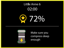
スコアと改善点のヒントをまとめた手技の要約