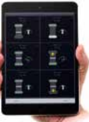
複数の受講生の手技の概要を表示する Instructorアプリ