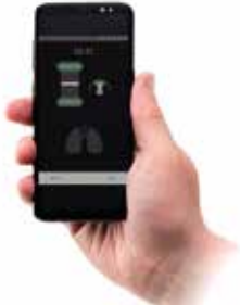
受講生が自分の手技を確認できるLearnerアプリ