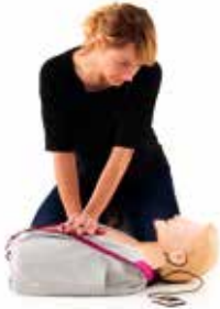
SkillGuide™によるプラグアンドプレイの接続オプション