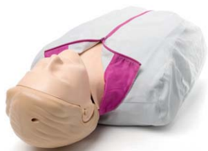
リアルで耐久性に優れた軽量デザイン

リアルで耐久性に優れたCPRトレーニングマネキンであるリトルアン® QCPRマネキンは、QCPR測定機能とフィードバックテクノロジーを搭載して機能が強化されており、質の高いバイスタンダーCPRトレーニングを実施できます。インストラクターはスマートフォンやタブレットをリトルアン® QCPRに接続して受講生に客観的なフィードバックとモニタリング結果を配信でき、トレーニングをより効果的、かつ効率的に進められるようになり、受講生は集中して積極的に学習に取り組めます。一度にモニタリング可能な受講生は最大6人です。リトルアン® QCPRがあれば、インストラクターは受講生一人一人に常に正しいCPRを学んでもらうことができます。