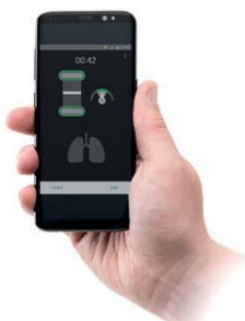
受講生が自分の手技を確認できるLearnerアプリ