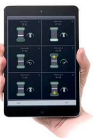
複数の受講生の手技の概要を表示する Instructorアプリ