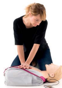
SkillGuide™によるプラグアンドプレイの接続オプション