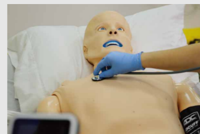
バイタルサインとリンクしたチアノーゼの再現