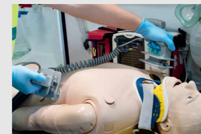
パッド式とパドル式の除細動に対応