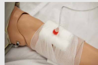
IV アクセス - 静脈内及び骨肉注入