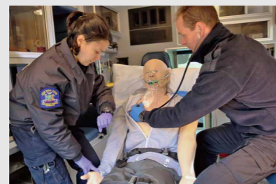
片肺挙上対応の気胸