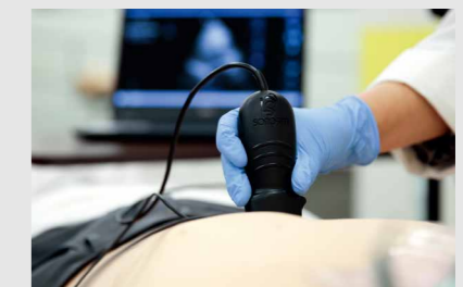
超音波ソリューション(別売)との連動