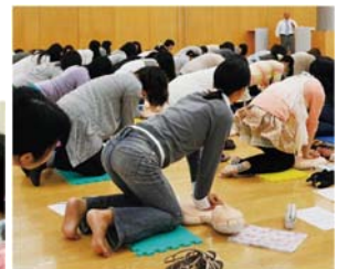
さまざまな職場で