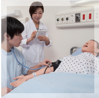
レサシアン シミュレータ PLUS