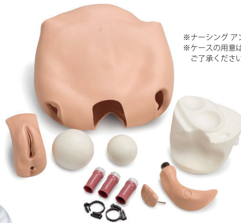
ナーシング アン 産後子宮底モジュール

※ナーシング アン本体は別売。 ※ケースの用意はございません。 ご了承ください。