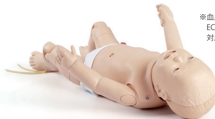
ナーシング ベビー