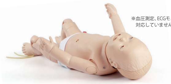
ナーシング ベビー