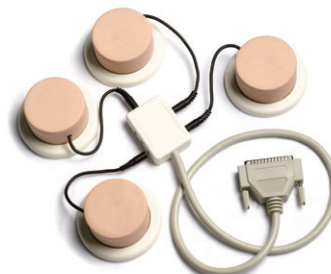
SimPad サウンドトレーナー

※製品版のケーブルは、SimPadリンクボックスと直接つなげられる形状になっています。