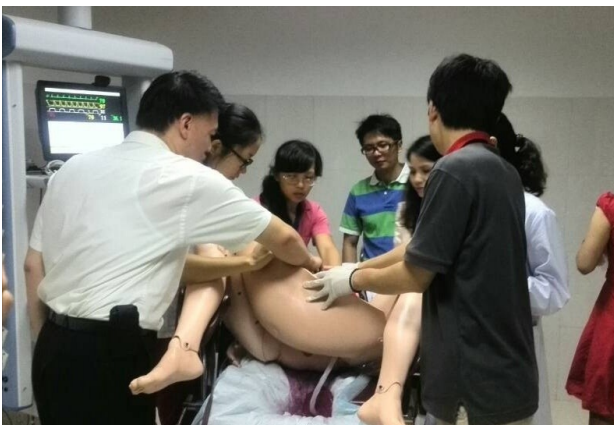
SimMom產後大出血病例練習