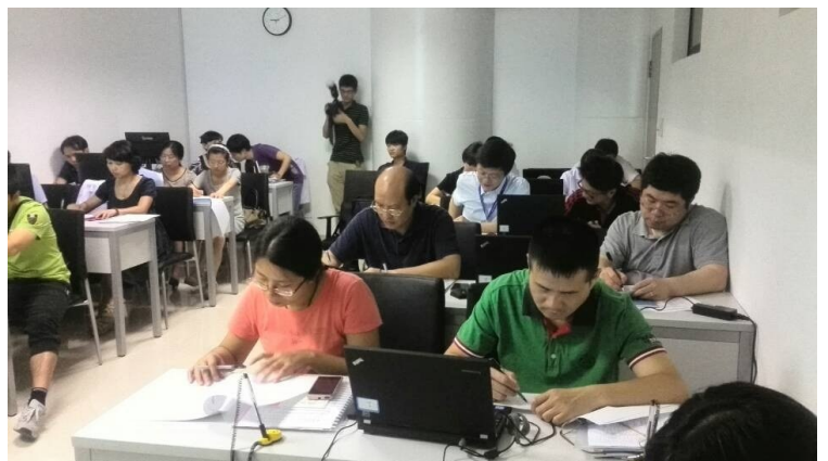
各位老師編輯病例中