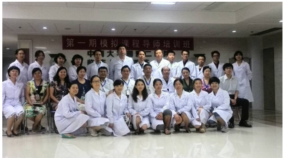
大合照。感謝湘雅二院領導及老師給予的支持和幫助

是次培訓班共有30多名來自全國的老師參加，在五天時間裡，在挪度教育專員的幫助下，學員們學會了運用一系列高端模擬人: SimMan 3G, SimMom, SimBaby, SimNewB, ALS Simulator。從簡單的組裝到病例編輯、導入、運行，還有模擬教育方法等。