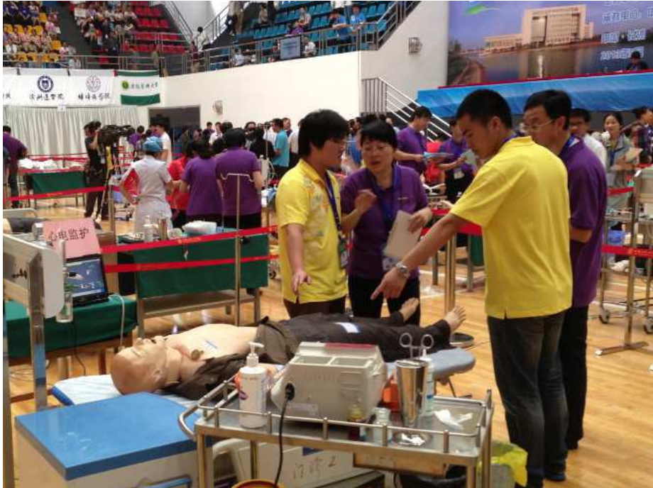
SimMan 3G被應用在技能大賽上