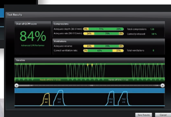
Debriefing der ausgeführten Maßnahmen