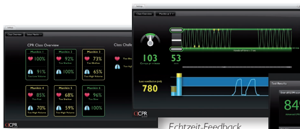
Umfangreiche Trainingsübersicht der Kursteilnehmer